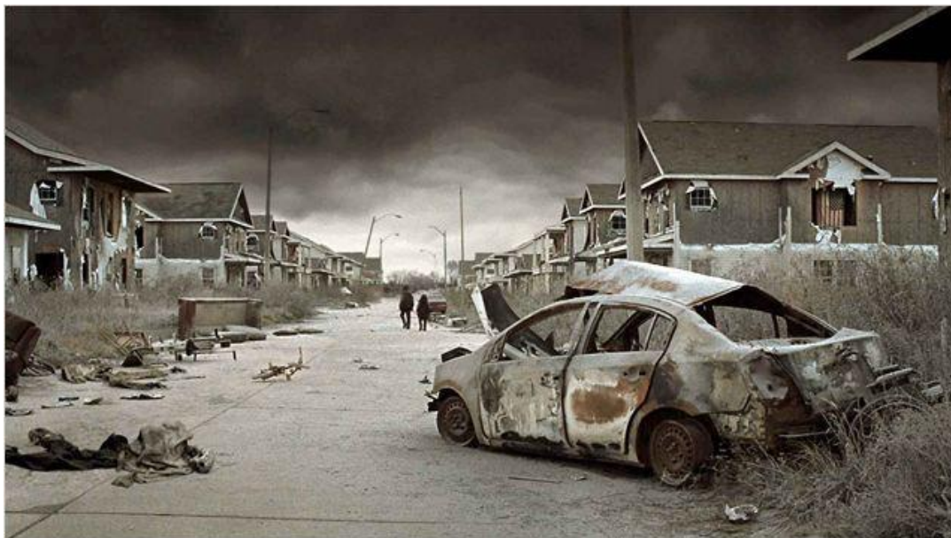
Image : le cinéma et la SF ne cessent de nous renvoyer l'image de notre propre apocalypse. Image tirée du film La route (2009) de John Hillcoat, adapté du bestseller de Cormac McCarthy

Si la littérature écologique a toujours été anxiogène, autant dire que l'avenir qu'ils dessinent est totalement déprimant puisqu'il est sans échappatoire aucun. L'imaginaire post-apocalyptique de Mad Max se dispute à celui de Walking dead , sans nous permettre d'entrevoir si l'un des deux serait mieux que l'autre.