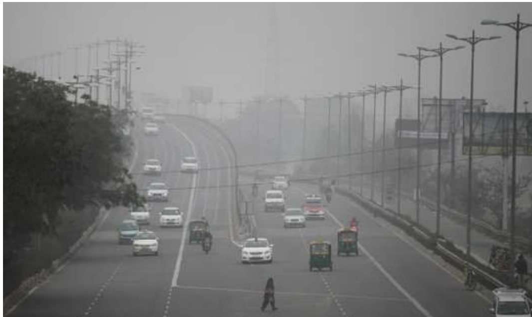
New Delhi, une des villes les plus polluées du monde.

LE MONDE | 02.05.2018 à 00h00 • Mis à jour le 02.05.2018 à 10h06 | Par Stéphane Mandard ( journaliste/stephane-mandard/ )