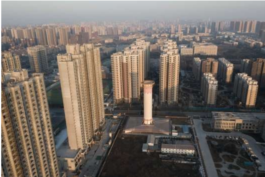
Vue aérienne montrant un tour d'épuration de l'air dans la ville de Xian, en Chine, le 13 février.

Les données compilées par l'OMS sont les plus complètes jamais publiées par l'institution sur la qualité de l'air. Elles se fondent sur les résultats des mesures effectuées dans plus de 4 300 villes de 108 pays, soit 1 000 villes de plus que lors du dernier bilan de 2016. Avec un « sérieux manque de données » pour le continent africain, où seuls 8 des 47 pays surveillent les niveaux de particules fines.