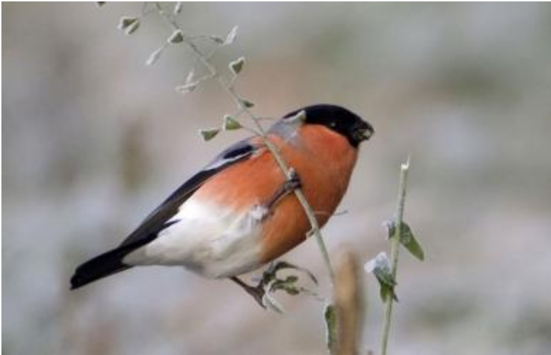
Paru dans leJDD

S'adapter ou disparaître... Face à la hausse du mercure, les oiseaux n'ont pas toujours le choix. Certains mettent le cap au nord, d'autres meurent en survolant le Sahara. En France, le nombre de bouvreils pivoine a chuté de 64% depuis 1989.