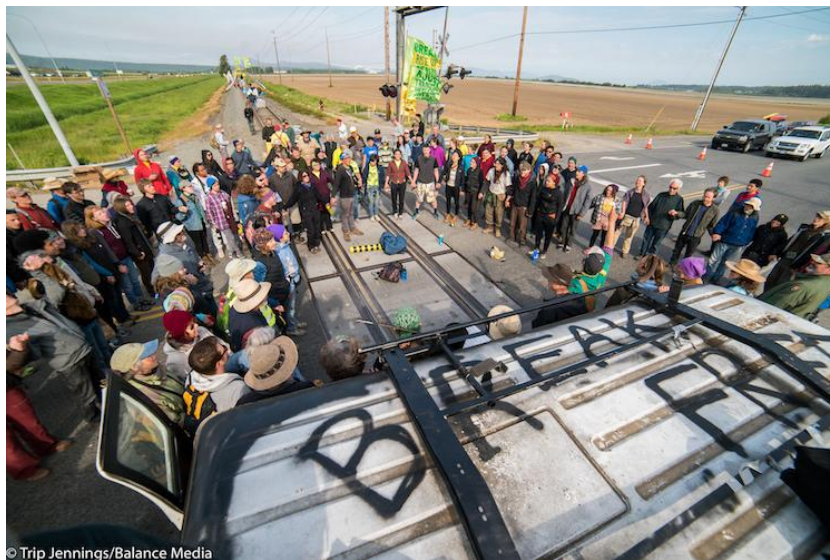
Des citoyen.ne.s se rassemblent sur la voie ferrée aux abords d'Anacortes, État de Washington, pour bloquer les « trains explosifs » qui transportent le pétrole vers les raffineries de la région.

Partout dans le monde, les populations savent reconnaître les signes qui ne trompent pas : les énergies renouvelables deviennent plus abordables tandis que la planète se réchauffe et l'industrie sombre dans une crise financière. Le moment est venu de se dresser contre la puissance de l'industrie des énergies fossiles et de protester contre ces pollueurs.