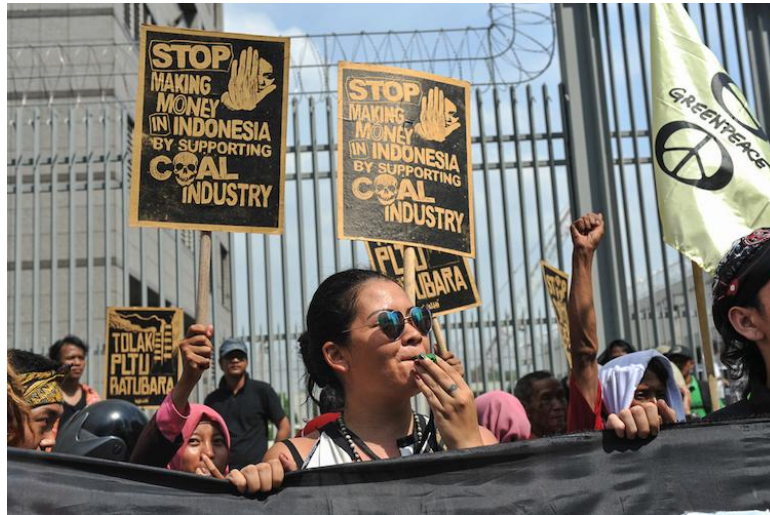
Les Indonésien.ne.s réclament la fin de la pollution par le charbon lors d'une bruyante manifestation devant le palais présidentiel de Djakarta.

Dans tous les pays où des actions ont été organisées cette semaine (Australie, Brésil, Canada, Équateur, Allemagne, Indonésie, Nouvelle-Zélande, Nigéria, Philippines, Afrique du Sud, Turquie, Royaume-Uni et États-Unis), la mobilisation pour se libérer des énergies fossiles va continuer plus que jamais, et les citoyen.ne.s qui y ont pris part ne sont pas seul.e.s.